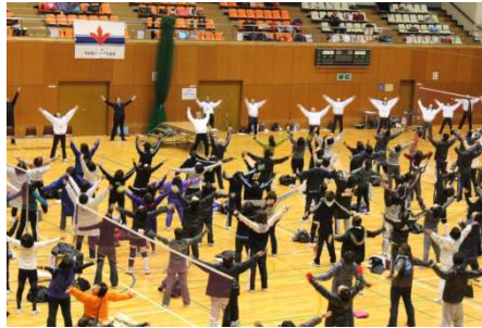
ラジオ体操でウォームアップ