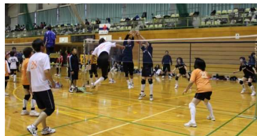
中央大会での優勝を目指して、各試合とも1点を競う好ゲームが繰り広げられました(試合風景)