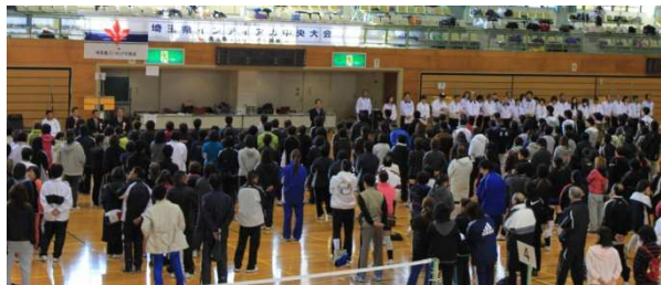
強豪チームが集う決勝戦開始(開会式風景)