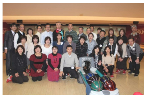
ボウリング参加者