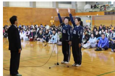
力強く選手宣誓!:ザ・イズ