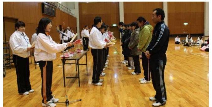
優勝チームへ赤い羽根が手渡されました!

2月13日朝霞市総合体育館に於いて第16回さくら草大会が開催されました。寒さ厳しい中、53チームが参加し、熱戦が繰り広げられました。