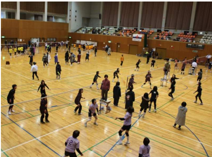
◇どのコートも楽しいインディアカが繰り広げられました◇