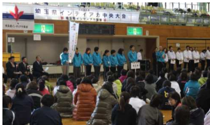
スポレク栃木出場報告:幸手市